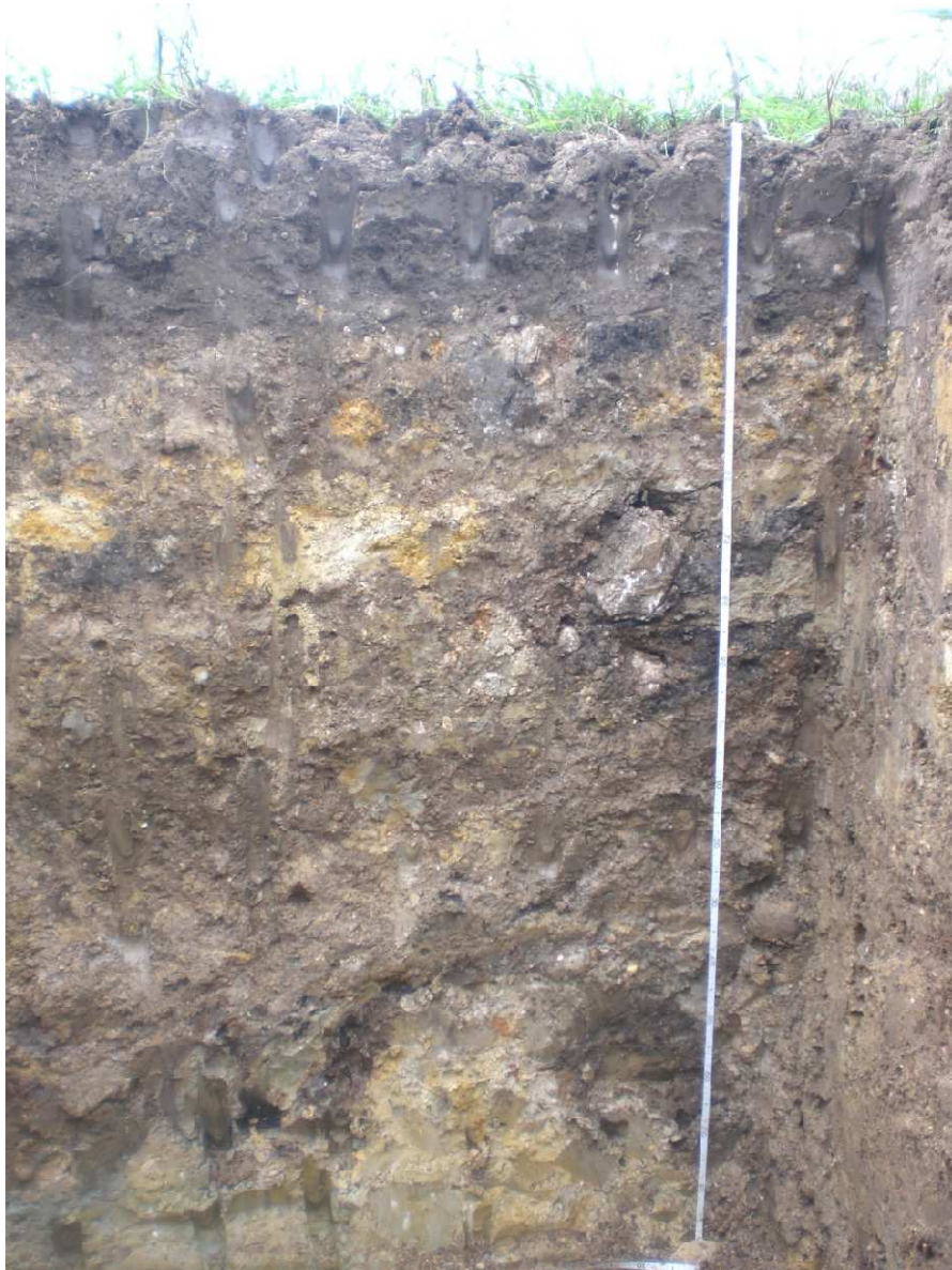
Fot. 1: Profilo AV-DE-A3-ST-05-GR2-01