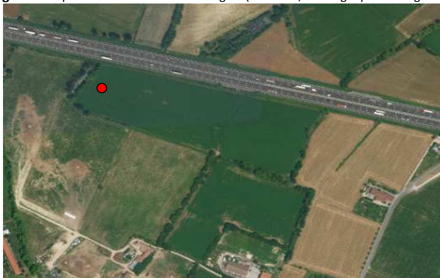
Figura 2: Foto aerea dell'area d'indagine