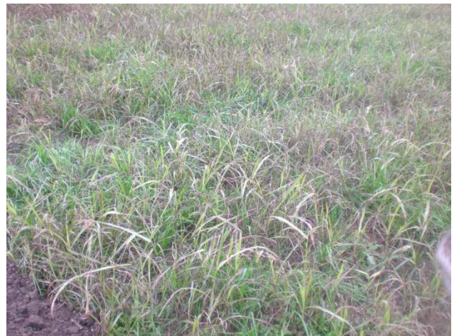
Fot. 6 Aspetti superficiali del terreno