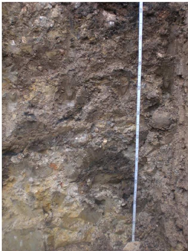
Fot. 5 Profilo AV-DE-A3-ST-05-GR2-01 dettaglio Orizzonte BCg (145-170 cm) e CgB (170-190 cm)