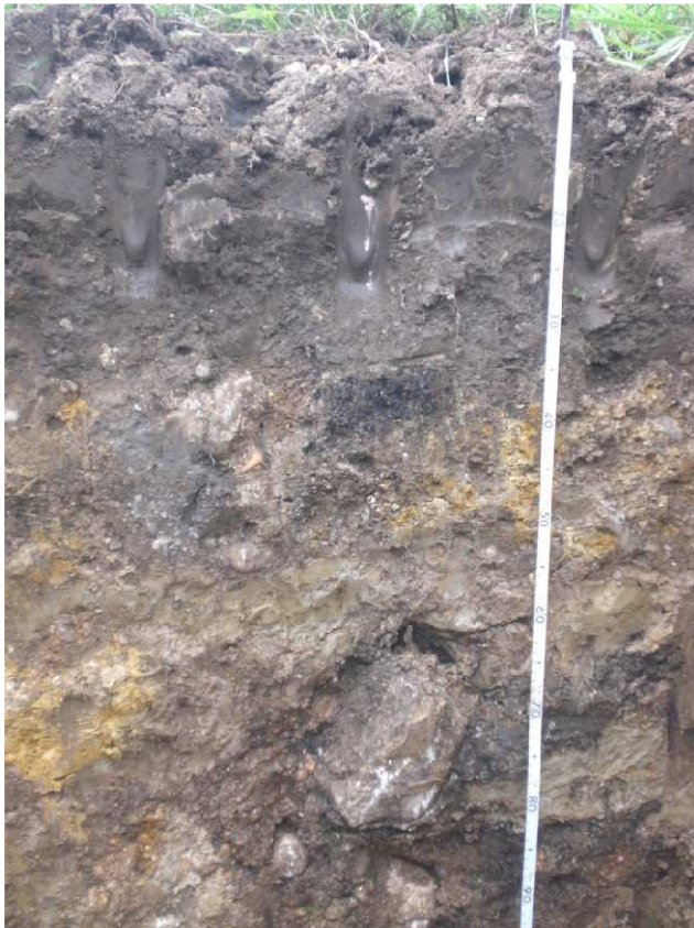
Fot. 3 Profilo AV-DE-A3-ST-05-GR2-01 dettaglio Orizzonte Ap (0-35 cm), AB (35-53 cm), BA (53-65 cm)