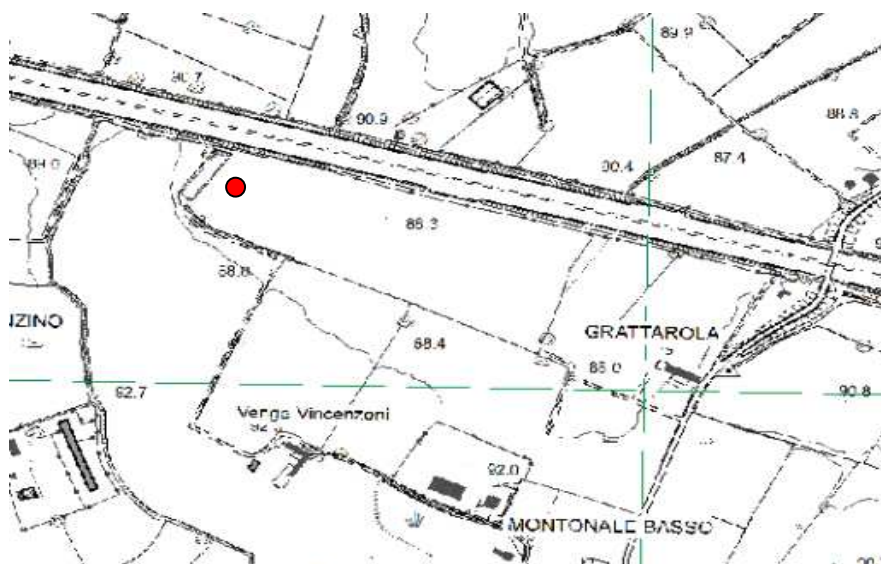
Figura 1: Inquadramento dell'area d'indagine (base CTR)