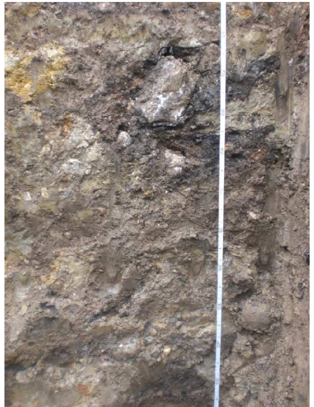
Fot. 4 Profilo AV-DE-A3-ST-05-GR2-01 dettaglio Orizzonte B1 (65-95 cm) e B2 (95-145 cm)