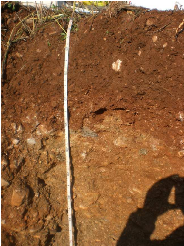
Fot. 3 Profilo AV-LO-EST-GR2-11 dettaglio Orizzonte Ap (0-38 cm) e B (38-53 cm)