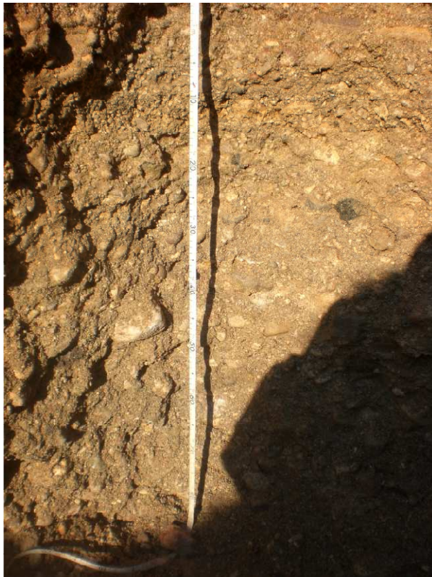
Fot. 5 Profilo AV-LO-EST-GR2-11 dettaglio Orizzonte Ck (120-190 cm)