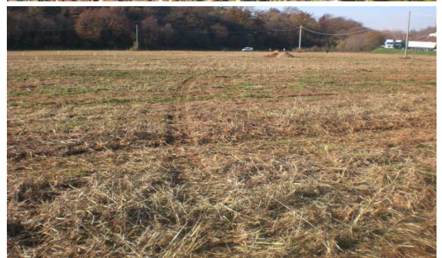
Fot. 6 Aspetti superficiali del terreno