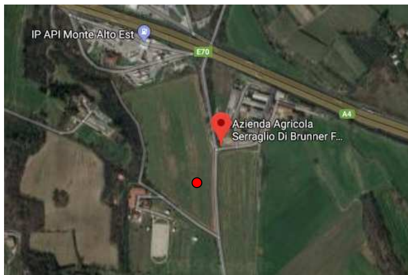
Figura 2: Foto aerea dell'area d'indagine