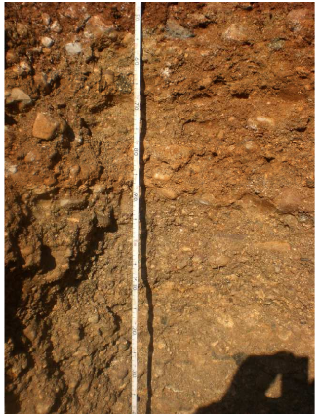
Fot. 4 Profilo AV-LO-EST-GR2-11 dettaglio Orizzonte BC (53-88 cm) e CB (88-120 cm)