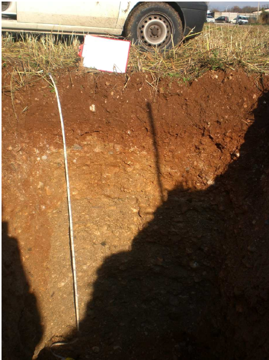
Fot. 1: Profilo AV-LO-EST-GR2-11