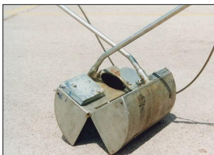
Esempio di benna Van Veen.

In ogni stazione sarà prelevato il livello superficiale (0-2 cm).